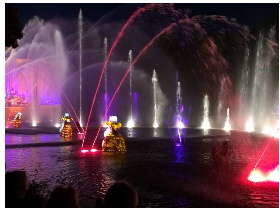
Les Orgues de Feu : la magie du son et lumières !