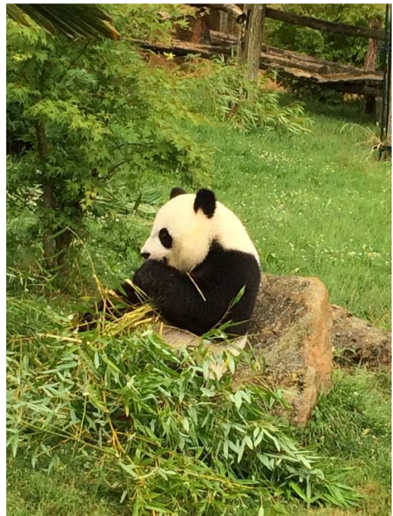
La star du parc, en pleine dégustation !

De son côté, un groupe de 9 pré-adolescents et adolescents a pu se rendre au Grand Parc du Puy du Fou du 5 au 8 juillet. Egalement accompagnés par 3 professionnels du service, les jeunes étaient cette fois hébergés dans 3 logements individuels au sein d'un village vacances.