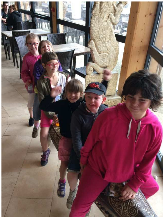
Petite pause photo après un repas bien mérité !