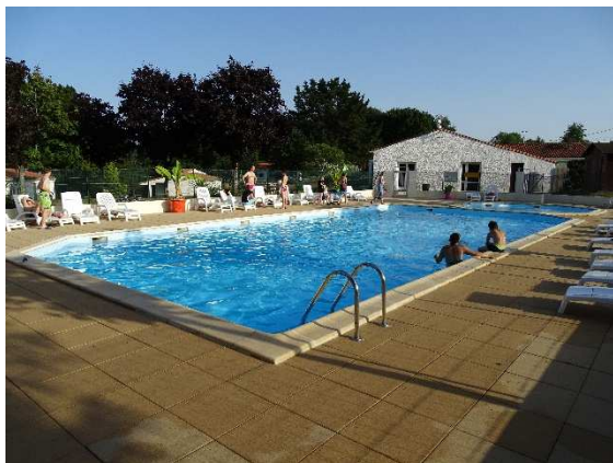
Temps de détente à la piscine...