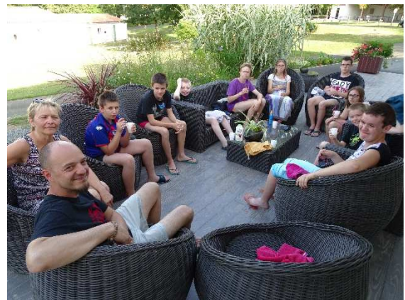
...puis petit moment convivial en terrasse pour « clore » ces deux jours magiques mais intenses !