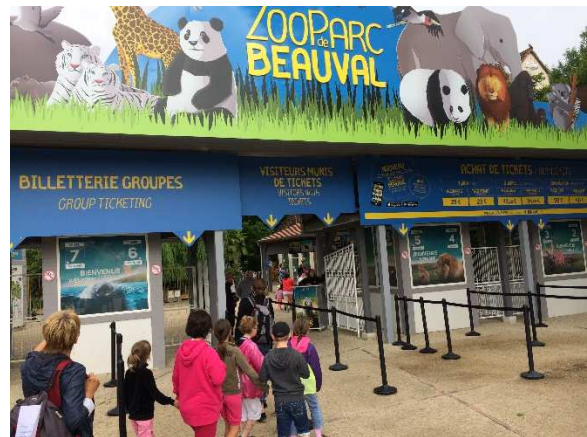
Nous voici enfin arrivés !