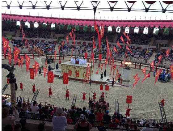
L'arène romaine et l'incomparable ambiance des jeux du cirque.