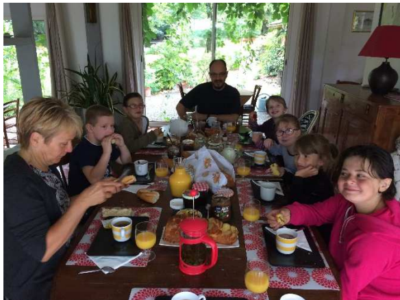
De l'importance de prendre des forces avant d'arpenter les allées du zoo !

C'est ainsi que 6 enfants ont pu se rendre au Zoo de Beauval du 28 au 30 juin dernier, accompagnés par 3 professionnels du SESSAD. Hébergés dans de charmantes chambres d'hôtes situées dans un cadre verdoyant à proximité du site, les enfants ont pu découvrir et parcourir le plus grand zoo de France et découvrir des espèces qu'ils n'avaient jusqu'ici pu voir qu'en photo.