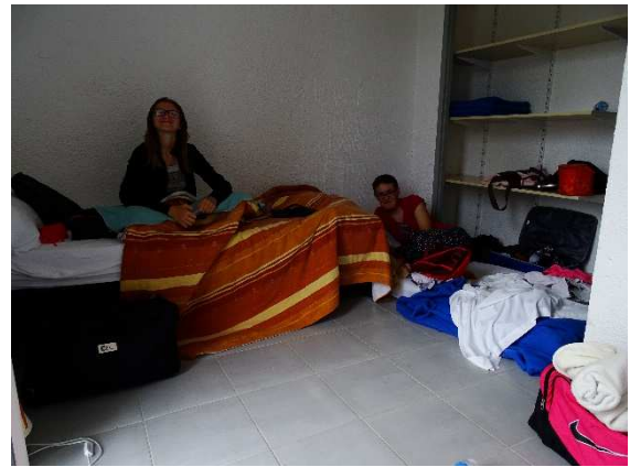
Retour aux hébergements avant d'affronter la deuxième journée...