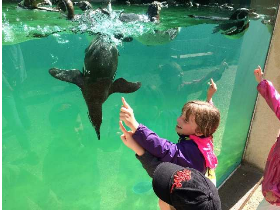
Les pingouins étaient disposés à jouer...