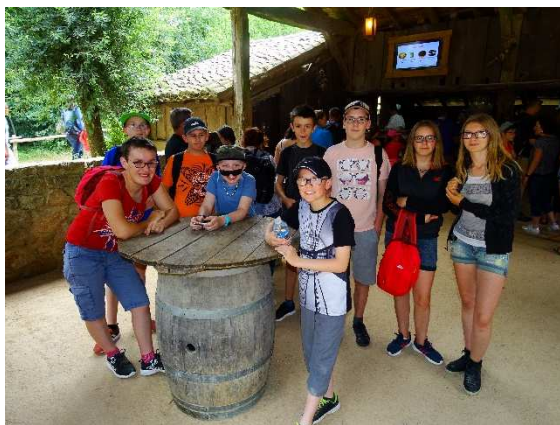
Petite pause repas bien méritée avant d'aller affronter les Vikings !